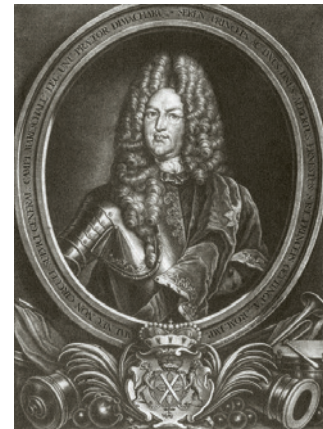
Abb. 41 Albrecht Ernst II. Kupferstich von Georg Kilian, um 1720.

auch die zitierten Lutheraner den gesellschaftlichen Umgang »zweier Nachbarn, deren gemeinsames Interesse das Bauwesen war«, 375 wohl einigermaßen falsch gedeutet. In Albrecht Ernsts Testament von 1729 nehmen ganz im Gegenteil Anordnungen großen Raum ein, die das Verhältnis des designierten katholischen Landeserben zur evangelischen oettingischen Landeskirche betreffen, nämlich, dass sie an der geistlichen Verfassung in Stadt und Land nicht das geringste ändern, sondern alles in dem alten und gegenwärtigen Stand belassen sollen. 376 Und doch darf nicht vergessen werden, dass zwar der Körper des Fürsten seine letzte Ruhstätte in der Harburger Schlosskirche fand, das Herz aber separat in der Klosterkirche der von ihm oft besuchten Reichsabtei Kaisheim beigesetzt wurde. 377