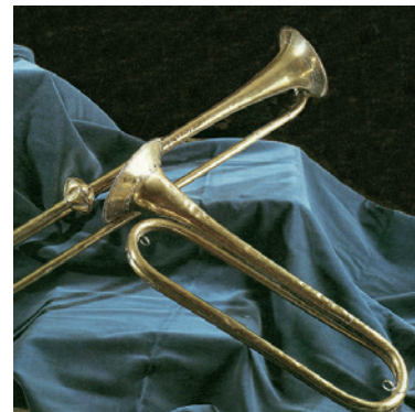
Abb. 80 Zwei oettingische Trompeten, um 1700.