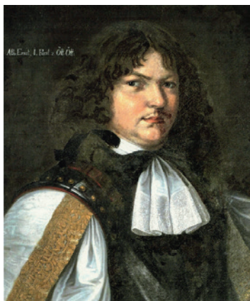
Abb. 14 Fürst Albrecht Ernst I. Ölbildnis, um 1674.